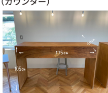
⑤いどばたげんかん (カウンター)